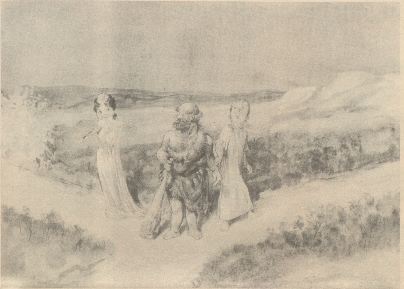
Herkules am Scheideweg