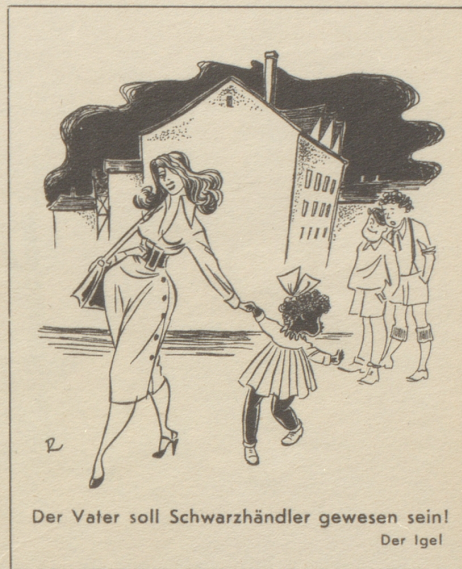
Der Vater soll Schwarzhändler gewesen sein! Der Igel

Unsere Buben streiten ab und zu miteinander. Als sie wieder einmal eine Auseinandersetzung hatten, höre ich den Kleinsten dem Großen zurufen: «Du spinnscht jo im höchste Gras!» ema.