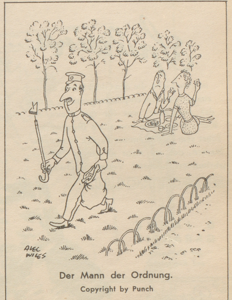
Der Mann der Ordnung.