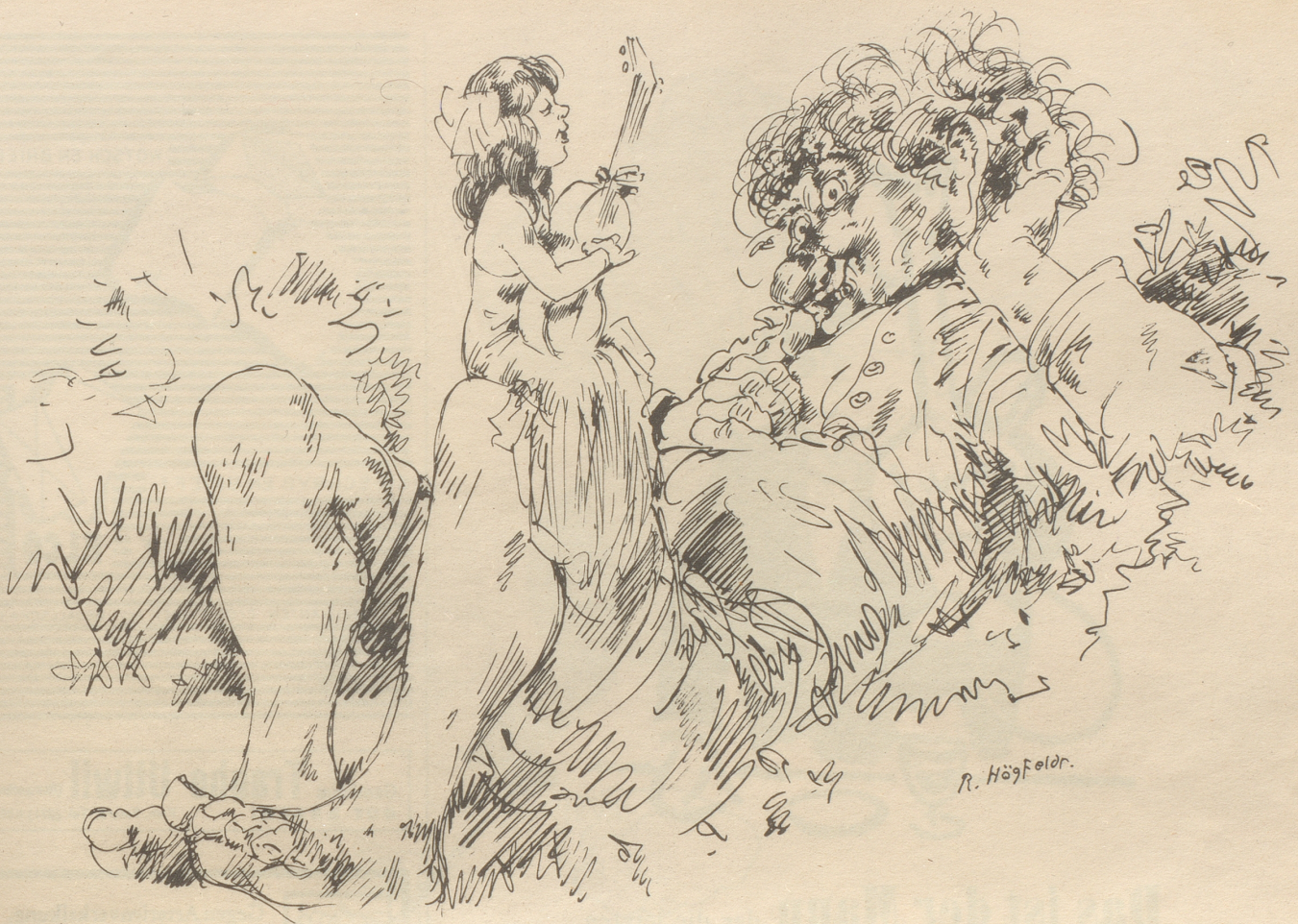
Der zartbesaitete Riese