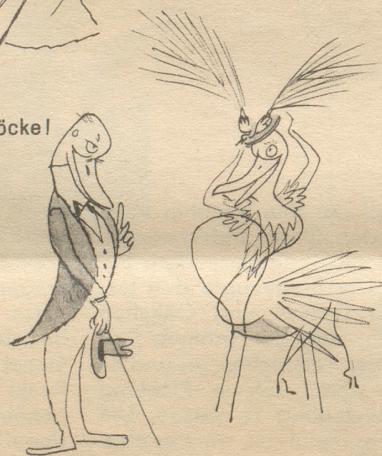
Vögeli will i nüt gsee uf dim Huet!