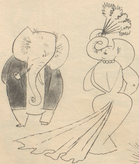
Schlepe chan ich nid schmöcke!