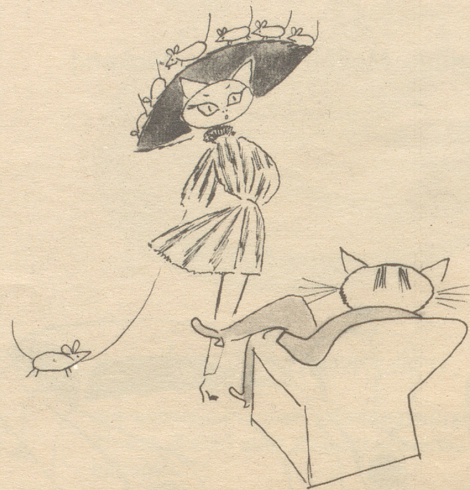
De Huet schiint mir e chli gwaaget!