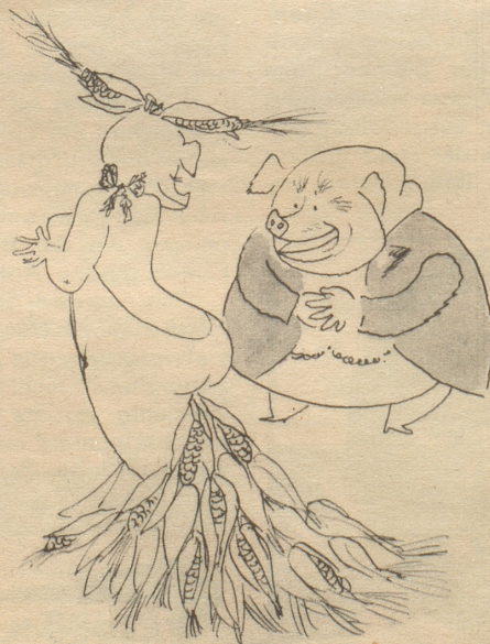
Isch es ächt nid e chli zwenig seriös?