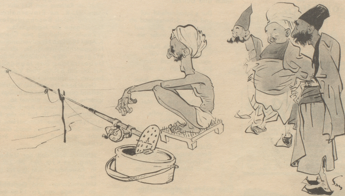
Fakir auf Urlaub