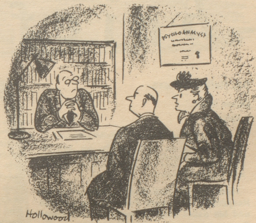
« Herr Professor, wir wollen wissen, wer von uns den Minderwertigkeitskomplex hat. »