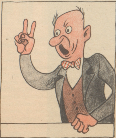
1948. Um weitere Tariferhöhungen vermeiden zu können, soll in Zukunft die Briefpost nur noch zweimal ausgetragen werden.

Innert 5 Minuten war mein Paß in Ordnung. GRM