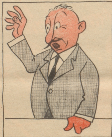
1958. Da die Ausgaben der PTT nicht mehr abgebaut werden können durch Sistierung einer Postaustragung, müssen die Tarife erhöht werden.