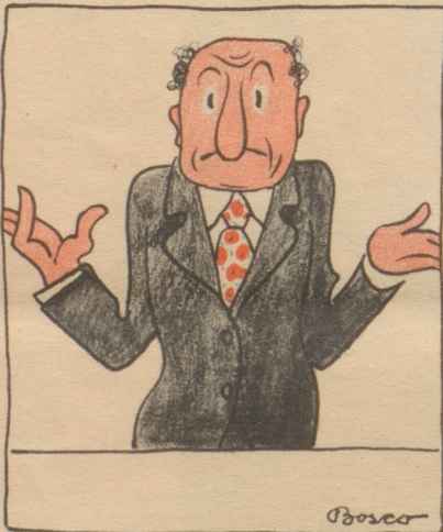
1954. Um weitere Tariferhöhungen vermeiden zu können, muß in Zukunft die Postaustragung wegfallen.