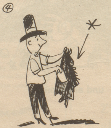
* ... er hat ja noch sein Los!