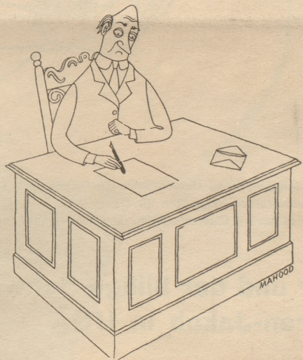
«Sehr geehrter Herr! Schon zum sechstenmal schreibe ich Ihnen, mir mitteilen zu wollen, wann ich meine Augen untersuchen lassen könne. Bis heute bin ich ohne Antwort geblieben.»

Die Wohlfat des Staates besteht darin, daß er der Hort des Rechtes ist. Jacob Burckhardt.