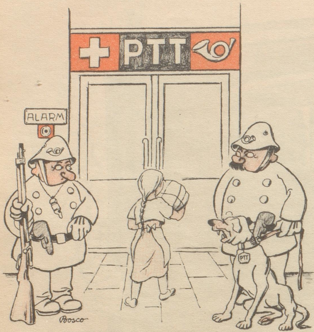
Bewaffnete Pöschtlter, ein Gebot der Stunde!

380 gesammelte Zeichnungen aus dem Nebelspalter von Carl Böckli und seinen Mitarbeitern aus der Zeit des roten und braunen Terrors: