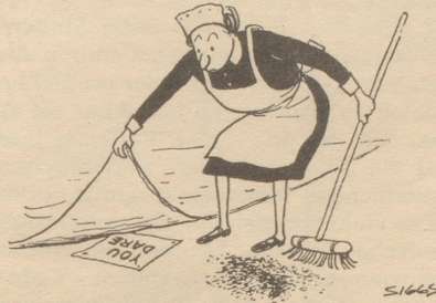
Sie dürfen ...

Soll ich nun, oder soll ich nicht? Trudy