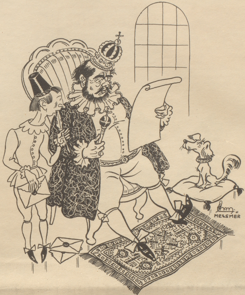
Protestnote in der guten alten Zeit

«Und weigern Sie sich weiterhin, mir auf direktem Wege eine Buße von hundert Fran-