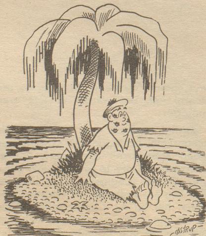
«Ich habe soeben sehr eindrücklich geträumt!» Tyrthans