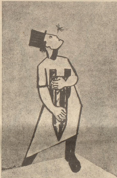
Die Menschheit, die Wasserstoffbombe und die unberechenbare Mücke.

Unlängst war mein Neffe als Pilger in Rom. In einer Pilgergruppe war ein älterer Junggeselle von W., ein gelungener Kerl. Der sagte: «Wißt Ihr, vor dreißig Jahren war ich nach Lourdes gegangen und habe um eine Frau gebetet, und jetzt mache ich eine Wallfahrt nach Rom, um dem Herrgott zu danken, daß ich keine gefunden habe.» WB