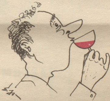
Sausser im (Übergangs) Stadium!

jetz nie en Antwort chönne gää?» Der Stillgebliebene nahm die günstige Gelegenheit wahr, um sich auch einmal zu melden und mit einem Ruck fuhr sein Arm in die Höhe: «Ich, ich.» H