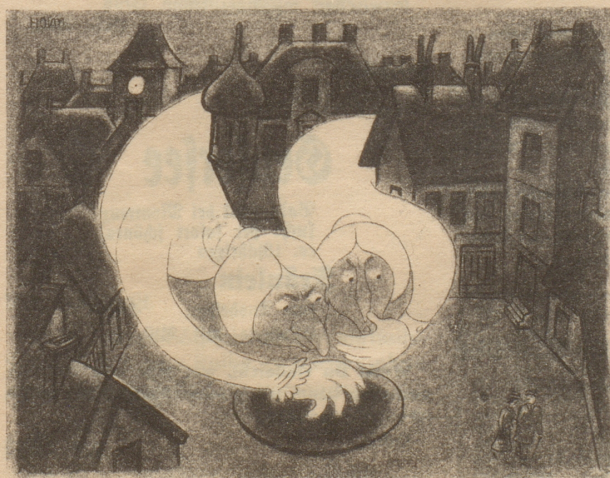
Kleinstadtleben Söndagsnisse Strix