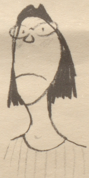
«En Ärmelschurz isch jedefalls s Aschtändigstcht!»

Nachschrift: Von mir nicht bemerkt hat meine Frau den Fragebrief mitgelesen und flüstert mir über die Achsel (mit Trägern!) zu: «Fischbein, Lieber, Fischbeinstäbchen!» — womit obige Anfrage keiner Antwort bedarf.