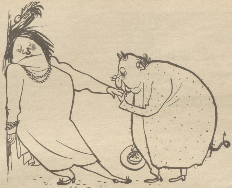
Mit der Eleganz wächst die Gefahr

«Zudem», fuhr er lächelnd weiter (allerdings nicht, ohne sich vorher vergewissert zu haben, daß möglichst viele Damen mithörten), «trage ich nicht allein die Schuld dieses kleinen Malheurs! Denn, sehen Sie, verehrte Dame, wer trägt heute noch sooo lang?! - - - Bitte, überzeugen Sie sich selbst.» Mit vornehmer Gebärde breitete er seine Modehefte über