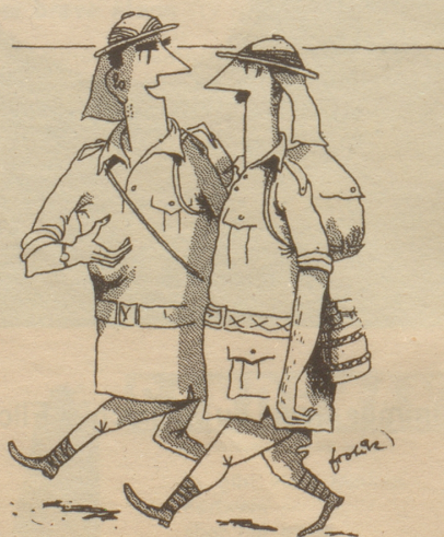
«Es ist ein grausamer Zehn-Tage-Marsch, aber es lohnt sich wegen der wunderbaren Fata Morgana!»

Um 7 Uhr früh fuhren wir los. Zuerst in ein Waisenhaus. Da sind sie nämlich schon früh auf. Wir mußten nur etwas warten, weil der Waisenvater noch am Rasieren war. «Muskatreiber?» sagte er, «leider nicht, meine Herren; in diesem Hause verwenden wir prinzipiell keine Gewürze. Wie? Nein, auch keine Muskatnüsse – prinzipiell nicht!»