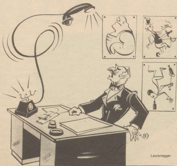
Es scheint wieder der hartnäckige Fakir zu sein, der anlätet!