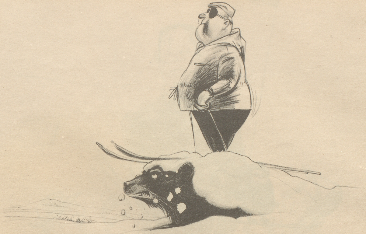
„...äntlich hettme si goldig Rued!“