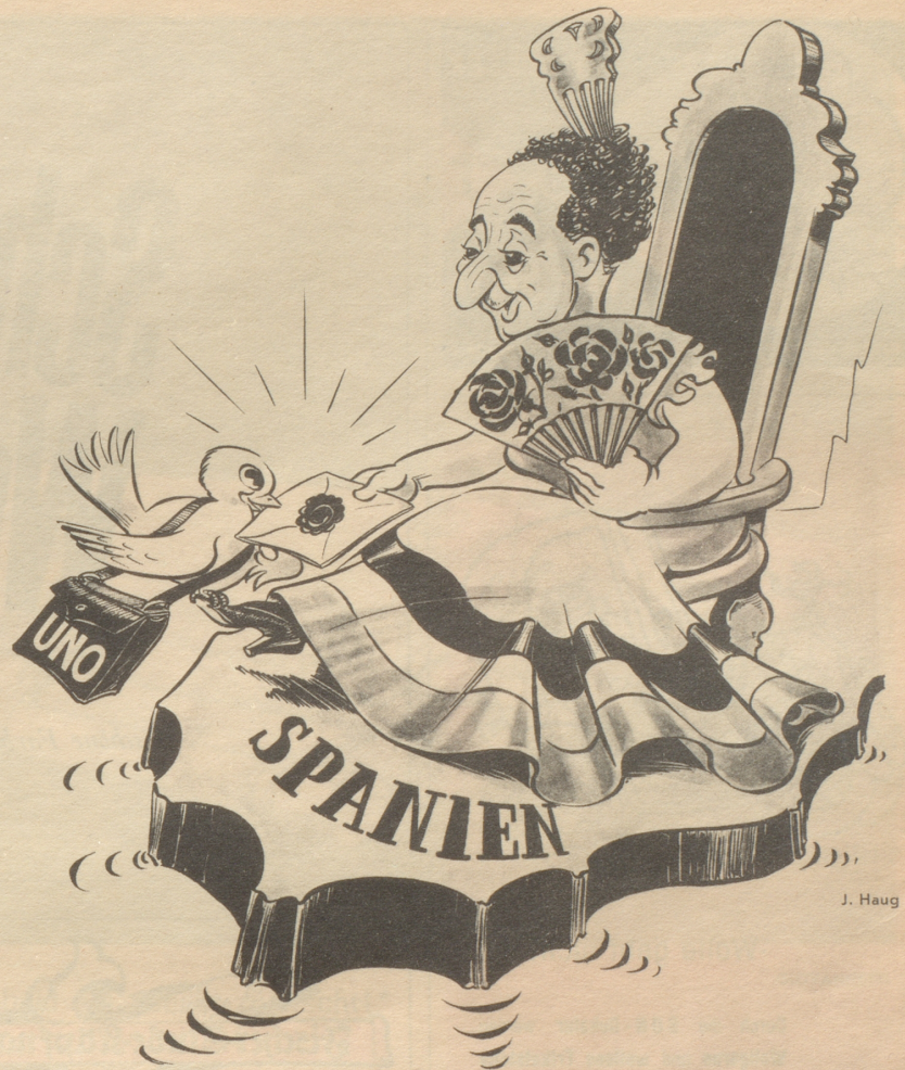
Spanien wird Uno-fähig

Was sagst du, Frau, der Hansruedi hat eine Scheibe eingeworfen? Der ...! Wo? Ach, bei den Suters? Ja, als ich zwölf war, war ich auch ein Lauser, das hat er von mir, haha! Bezahlen? Warum sollen wir die Scheibe bezahlen? Die können Suters selbst bezahlen, so etwas kann doch wohl vorkommen. Klagen? Die werden sich hüten zu klagen. Woher sollen die das Geld für einen Anwalt nehmen, wenn er so off krank ist und die Frau zu dir putzen kommt. Und die Stelle bei uns wäre die Frau dann auch los. Was sagst du, das Schlafzimmerfenster ist es, und sie haben jetzt mitten im Monat nicht das Geld für eine neue Scheibe? Was geht uns das an, wenn die Leute nicht zu wirtschaften verstehen? Ein Mensch wie der Suter hat doch seine paar Hunderter auf dem Büchlein zu haben, auch wenn er hin und wieder einmal ein bißchen krank ist. (Was dem Suter seine Hunderter, sind andern eben ihre Zehntausender, hahaha!) Außerdem – Schlafzimmerfenster sind noch am günstigsten. Solche