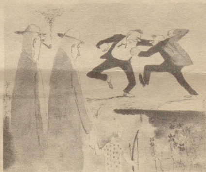
„Warum streiten sie?“ „Oh, sie sind sich nicht einig, ob Amerika oder Rußland den Frieden will.“ Söndagenisse Strix

Fremde, bei dir zu Besuch, Schenken oft Schimpf dir und Fluch, Wenn sie vor Hunger vergehn, Dürstend ersuchen und flehn Um ein Getränk in der Stadt. Still ruht, zufrieden und satt Lange schon groß drin und klein — Schlafe, Provinzchen, schlaf ein!