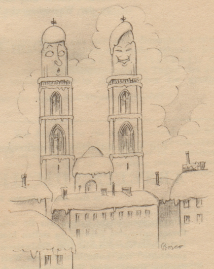
„Wie hät au dä sini Chappe wider uf!“