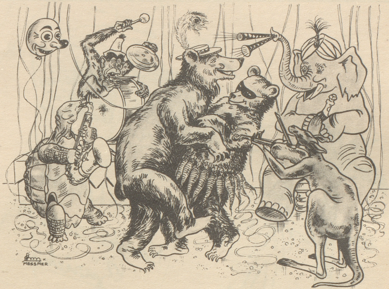
Wenn Tiere tun wie Menschen...

An der Technischen Hochschule in Prag lehrte um das Jahr 1900 ein Pro-