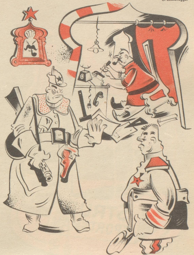
„Genosse Stalin gibt heute keine Audienz. Er ist eben im Begriff, das Telefon zu erfinden, Genosse Volkskommissär!“