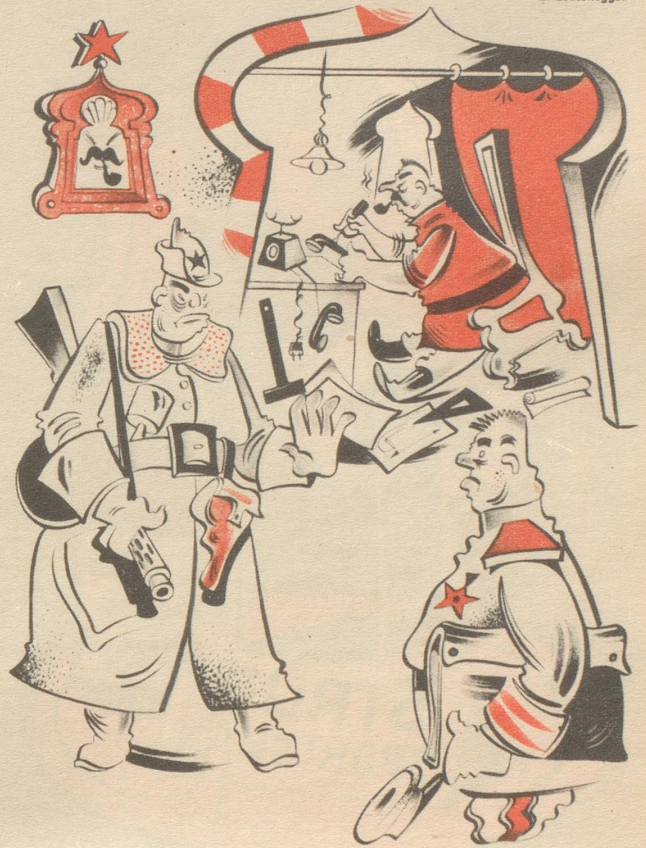
„Genosse Stalin gibt heute keine Audienz. Er ist eben im Begriff, das Telefon zu erfinden, Genosse Volkskommissär!“