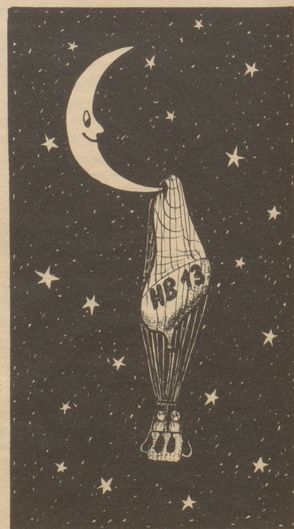
Bei Vollmond wäre das nicht passiert

Stoßzeiten: wenn man am meisten pressiert ist und am langsamsten vorwärts kommt. ew