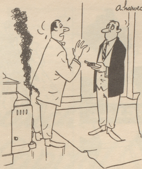
„Danke, ich rauche nicht!“ France Dimanche

In der 11. Zeile von unten auf der 2. Spalte des Bethli-Artikels «Rührung im Kino» in Nr. 12 ist ein sinnwider Fehler stehengeblieben. Es muß heißen: «Es ist nicht herrliche, genüßreiche Theatertragik» (statt Theaterkritik).