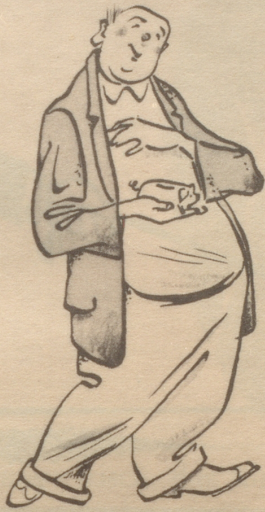
Gemütvoller Fünfziger mit etwas Erspartem, sucht...