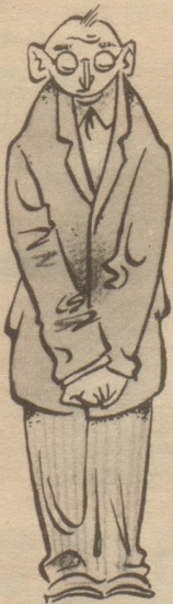
Brillenträger, bescheidenes Wesen, ersehnt sich...