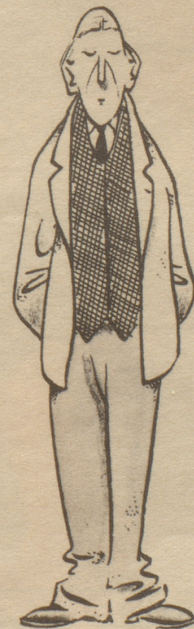
Vom Leben Enttäuschter, wagt noch ein letztes Mal...