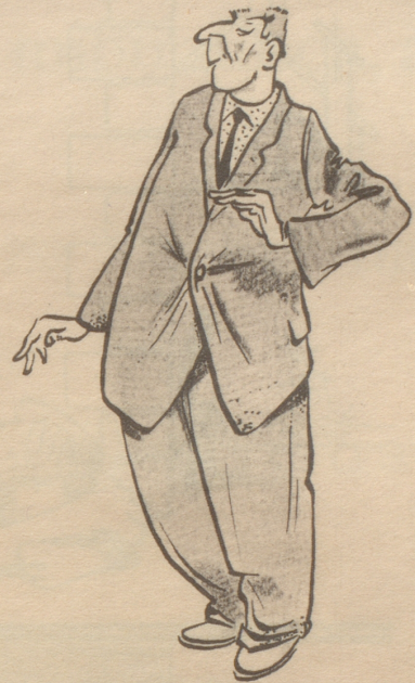
Musisch veranlagter Kleinrentner möchte...