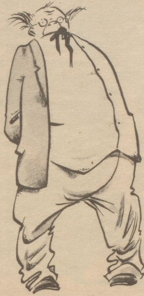
Bin schuldlos geschieden, musikliebend, energisch. Wer wagt es...?