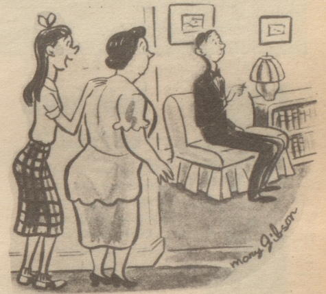
„Sieh nur, wie er seine Zigarette hält — genau wie Gregory Peck!“

Geschehen in einer großen Privatklinik in New York.