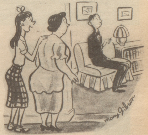
„Sieh nur, wie er seine Zigarette hält — genau wie Gregory Peck!“

Geschehen in einer großen Privatklinik in New York.