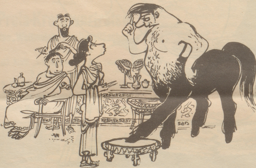
nicht gern gesehen als Kunde,