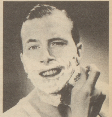
Immer Pitralon - Macht die Haut glatt und sauber. Verhindert Infektionen. Flacons à Fr. 2.- und 3.-.