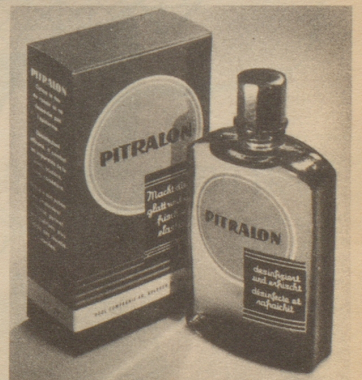
Verlangen Sie auch im Salon von Ihrem Coiffeur nach dem Rasieren regelmäßig Pitralon für Ihre Haut.