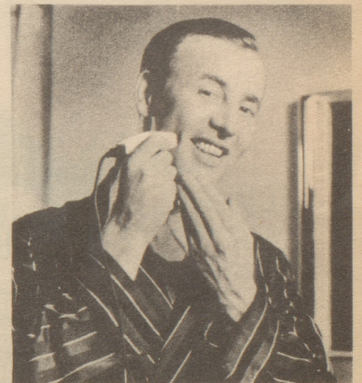
Pitralon für alle Herren, auch für Elektro-Rasierer. Pitralon nach dem Rasieren mit der Hand auftragen.