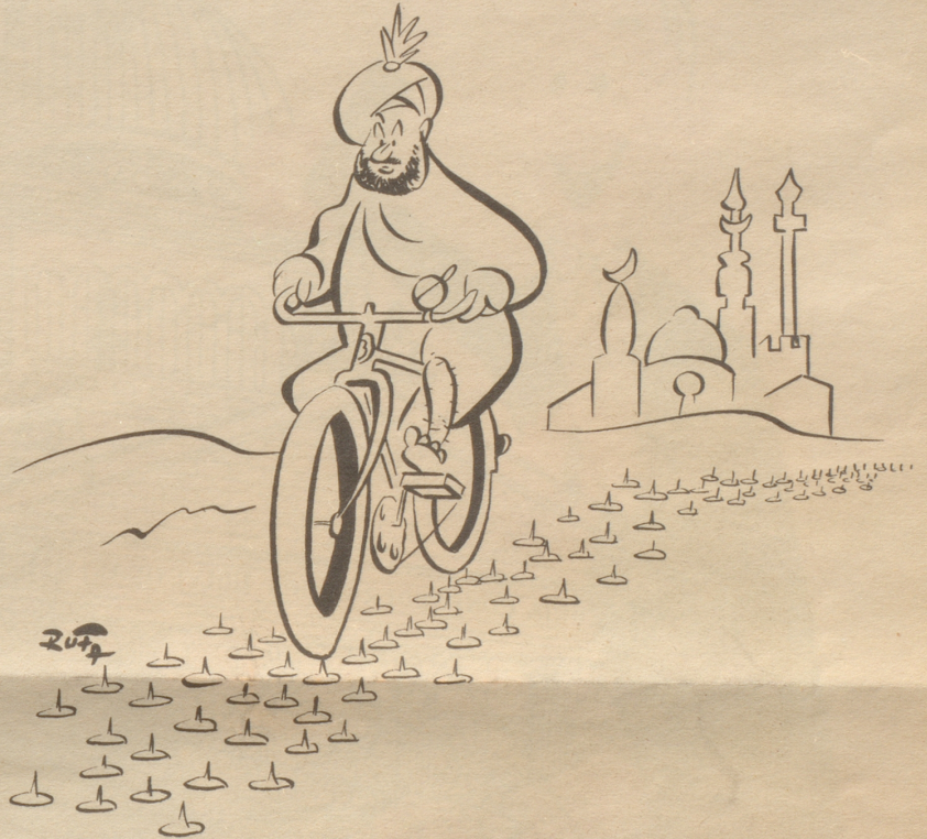
Fakir fährt aus

Mit freundlichem Gruß Verlag des Nebelspalter.