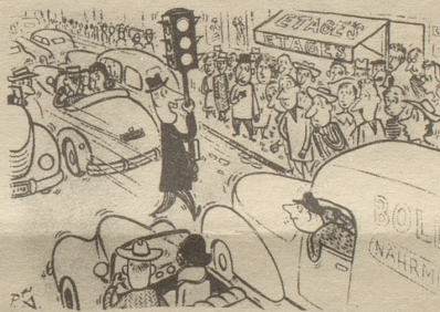
«Mein Patent, um in der halben Zeit ins Büro zu kommen!» Frankfurter Illustrierte