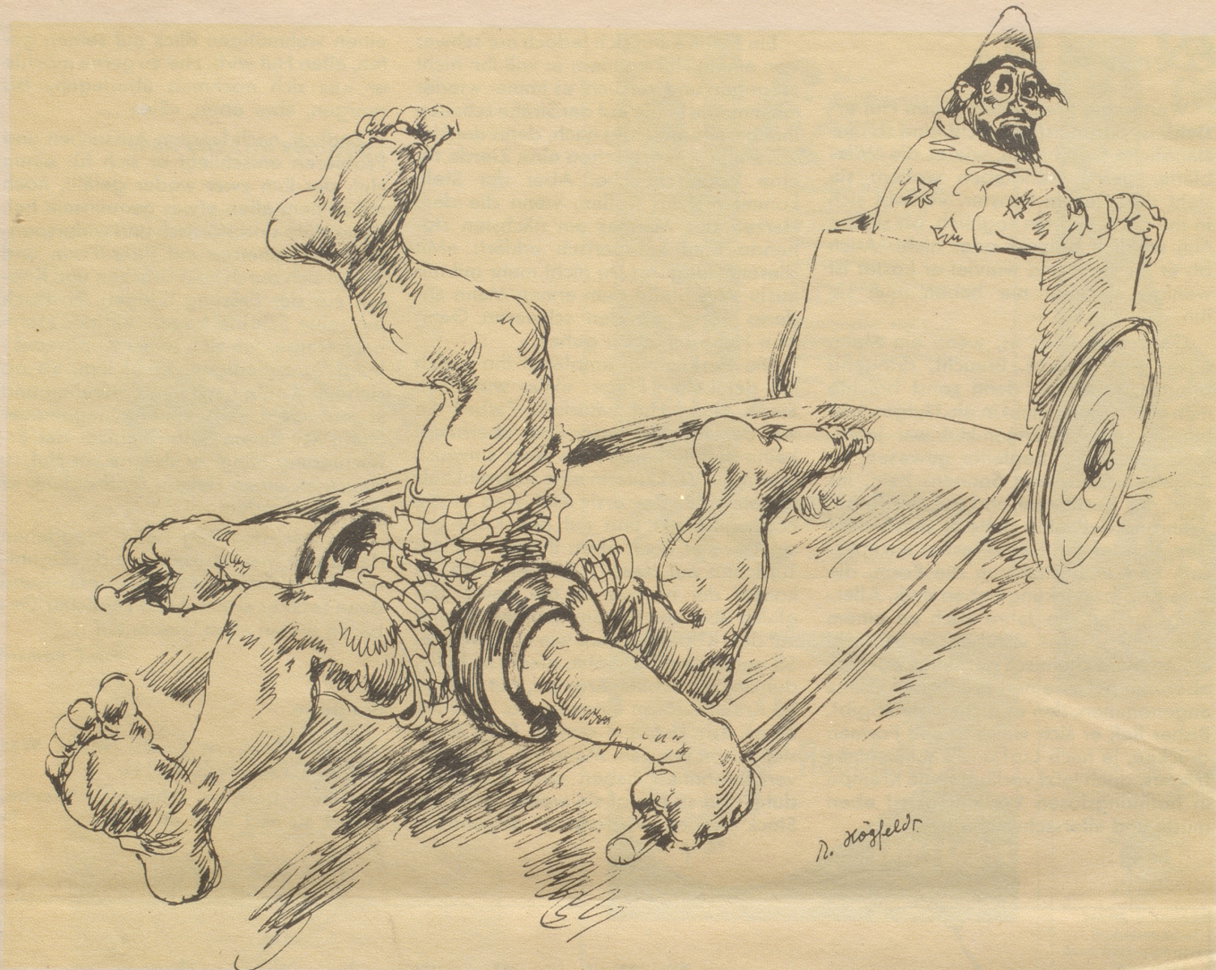
Hexenmeister fährt spazieren!