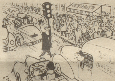
«Mein Patent, um in der halben Zeit ins Büro zu kommen!» Frankfurter Illustrierte