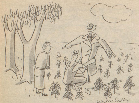
„Sollte nicht ein Männerkittel auf die andere Seite geschlossen werden?“

Seine oder im Etschtal stand, denn Paris ist Frankreich, und mit Wien ist es dasselbe ... Figuriert sein Geburtsort gar in einem schweizerischen Ortsverzeichnis, dann hat er sicher in einer der beiden Hochburgen „studiert“. So besitzen sie alle Charme und savoir-vivre, und sagen trotz allen Diskussionen um ‚Dame‘ und ‚Frau‘ eigensinnig «Madame» oder «gnädige Frau».