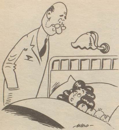
«Ist es vielleicht, weil mein Mann stottert, Herr Doktor?» Tyrrihans

auflockernd und hübsch klingt das leicht hingeworfene «Aussteigen, Gnädigstel» eines Salzburger Bus-Kondukteurs zum Beispiel! (In Salzburg heißt ein Bus zwar Obus!) Wie nett für eine Schweizerin, zu entdecken, daß sie in Österreich ganz einfach um ihres Geschlechtes willen Anrecht hat auf ein höfliches, zuvorkommendes Benehmen von seiten des andern Geschlechtes, auch wenn zugegebenerweise die «gnädige Frau» und «meine Gnädigste» leicht hingeworfene Floskeln sind. Sie sind