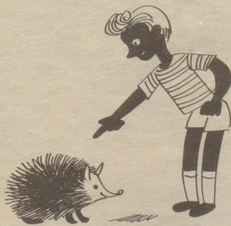
Der Igel ist, das wissen wir, der Inbegriff vom Stacheltier.