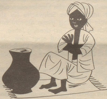
Dass Inder Indianer sind, behauptet nur, wer farbenblind.