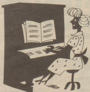
Das Istrument, auf dem sie spielt, hat sie durchs grosse Los erzielt!