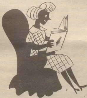
Ich lese immer mit Genuss „Die Kraniche des Ibykus“.