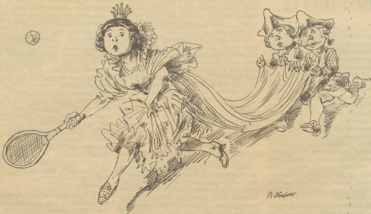
Prinzeßchen geruht zu spielen