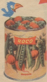
Erbsen mit Carotten fein: die beliebte und gesunde Gemüseplatte.