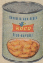
Roco Eier-Ravioli - nicht umsonst die beliebtesten!