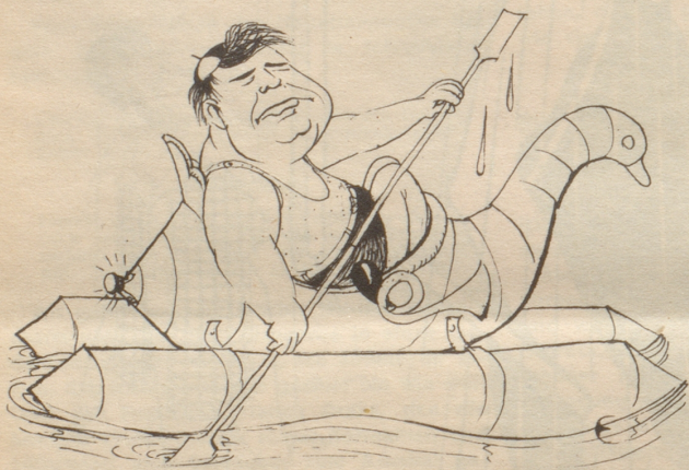
Wagnertenor im Sommerurlaub