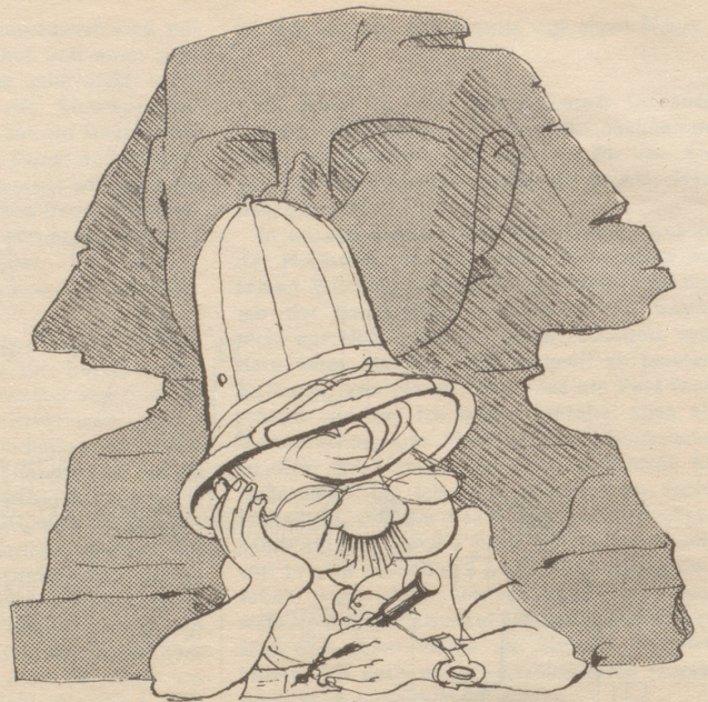
„Wänn i wüsst wieme s Pflinx schribt würd ich etz e Poschtcharte helschriibe!“