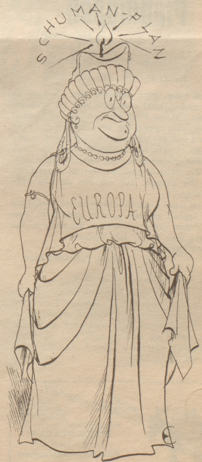
Mütterchen Europa geht ein Licht auf