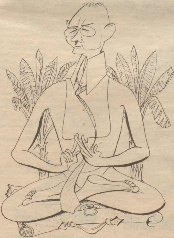
Der anpassungsfähige Schacht ist Finanzberater der indonesischen Regierung

Senkrecht: 1 Ur, 2 Agonie, 3 Sirnach, 4 Schlag-sahne, 5 Boa, 6 et, 7 Bs., 8 der, 9 mir, 10 Etaf, 11 Hafen, 12 Aera, 13 Tag, 14 SO, 15 Bela, 16 tuell, 17 ignorieren, 18 im, 19 stramm, 20 in, 21 Trunk, 22 Damen, 23 Eve, 24 Aas, 25 Dame, 26 Elm, 27 Rebellion, 28 Tadel, 29 Nebel, 30 Titel, 31 nid, 32 und 33 Soirée, 34 Linnen, 35 Braue, 36 Bum, 37 nei.