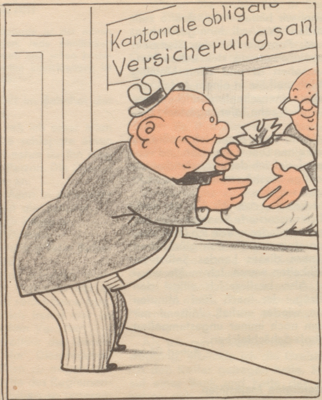
„Da hänzi au öppis an Schaden ane!“