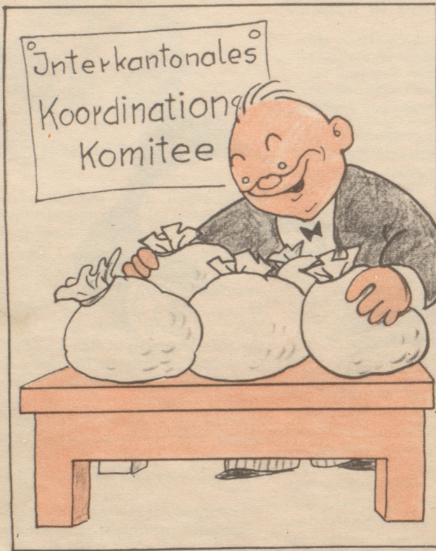
„Etz lueg au da — das hilfsbereite Schwizervolch!“