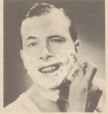
Immer Pitralon - Macht die Haut glatt und sauber. Verhindert Infektionen. Flacons à Fr. 2.- und 3.-.