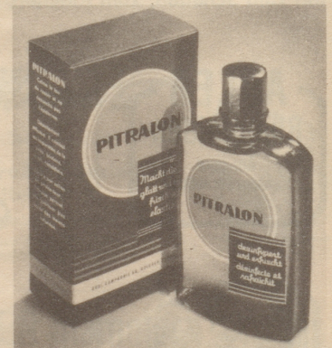
Verlangen Sie auch im Salon von Ihrem Coiffeur nach dem Rasieren regelmäßig Pitralon für Ihre Haut.