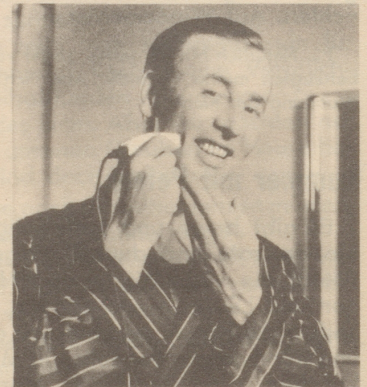
Pitralon für alle Herren , auch für Elektro-Rasierer. Pitralon nach dem Rasieren mit der Hand auftragen.