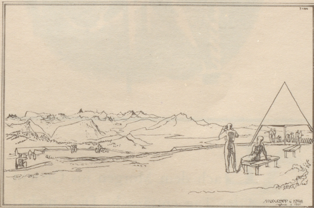
Rigi-Kulm Aussicht vom Gipfel gegen Süden nach der Umgestaltung