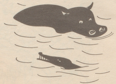
Dem N ilpferd und dem Krokodil begegnet öfters man am Nil.