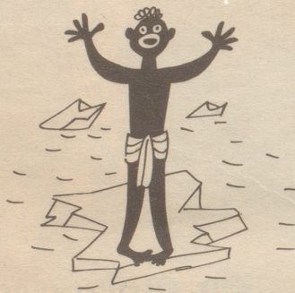
Den N eger, der am Nordpol friert, begreift man, wenn er protestiert.