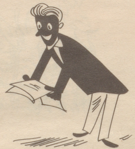
Die N achricht überrascht den Mann, dass er das grosse Los gewann.