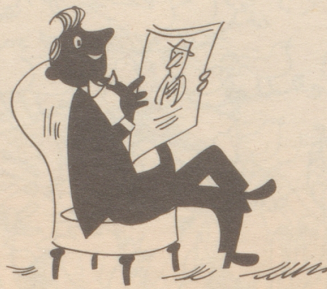
Der N ebelspalter ist ein Blatt, an dem man immer Freude hat.