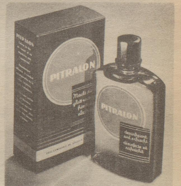
Verlangen Sie auch im Salon von Ihrem Coiffeur nach dem Rasieren regelmäßig Pitralon für Ihre Haut.