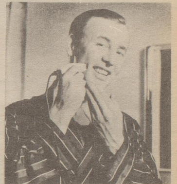
Pitralon für alle Herren, auch für Elektro-Rasierer. Pitralon nach dem Rasieren mit der Hand auftragen.