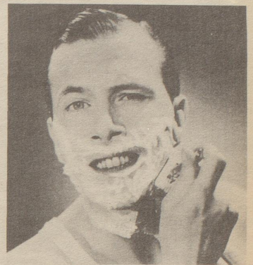
Immer Pitralon! Macht die Haut glatt und sauber. Verhindert Infektionen. Fr. 2.10 u. 3.10 Wust inbegr.