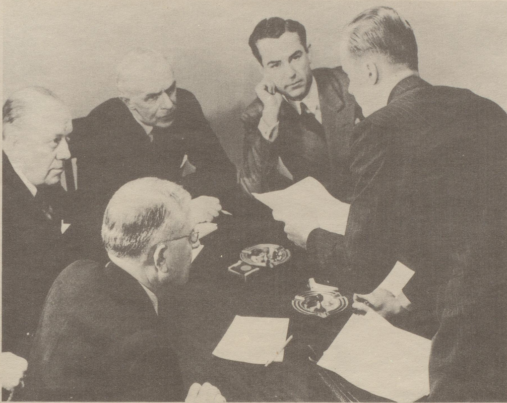
Der Präsident, Hr. Dr. Frey und die anderen Herren der Aufsichtskommission wissen: Rasierter Haut braucht Pitralon. Welche Wohltat ist Pitralon nach dem Rasieren. Pickel und Mitesser verschwinden.