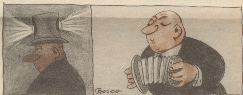
als Leuchtturm (um sich Autofahrern nachts sichtbar zu machen)